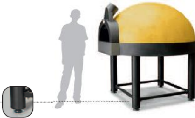
Pied réglable standard