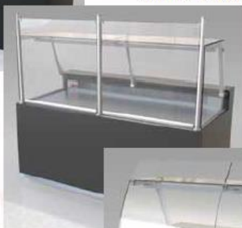
modèle Bistrot SA

La structure arrière offre une tablette de présentation, posée sur des bras en aluminium anodisé. Ces bras peuvent être laqués selon votre choix (références «RAL»). Le système de verrouillage et déverrouillage du vitrage s'intègre parfaitement à la structure et à son design. Il suffit d'une main, en tirant l'embout du montant vers le haut, pour déverrouiller le vitrage et le nettoyer.