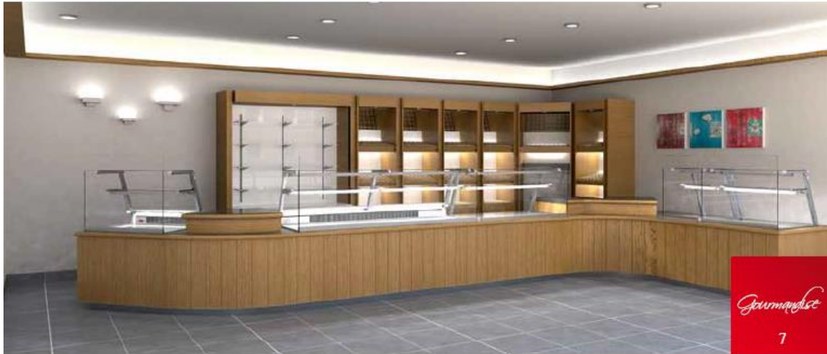
Exemple de réalisation de magasin, présenté avec options.