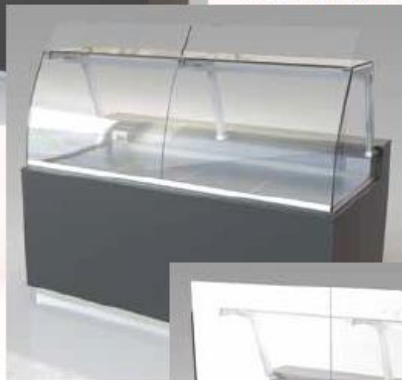
modèle Plein Cintre

Le vitrage plein cintre est basculant : autoporté par la structure arrière, aucun verrouillage n'est nécessaire. Cela facilite le nettoyage et l'entretien. Le profil de repos fait office de charnière. Sa structure robuste et parfaitement calibrée permet une manipulation du vitrage sans effort et sans risque de casse.