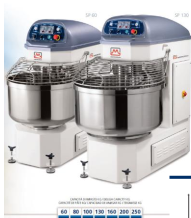
DIMENSIONI / DIMENSIONS / DIMENSIONEN / DIMENSIONES / ABMESSUNGEN