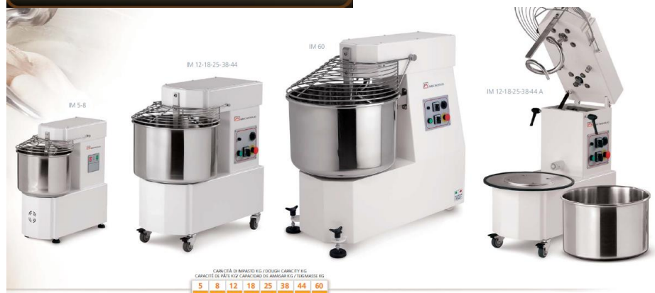
CAPACITÀ DI MIXATO KG / DOUGHA CAPACITY KG CAPACITÉ DE PÂTE KG / CAPACIDAD DE AMASADO KG / TONNAGES KG 5 | 8 | 12 | 18 | 25 | 38 | 44 | 60