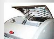
Option Capot de sécurité (ouvert)