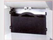
Bac à miettes