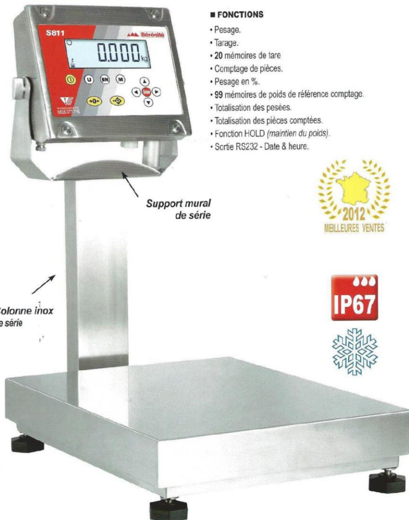
Support mural de série