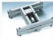
Colonne inox de série