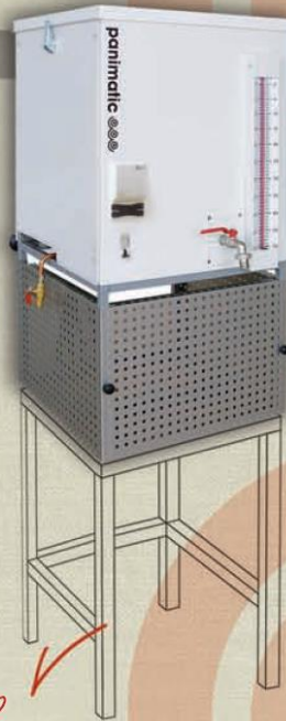
REV 50/50 sur chaise en option