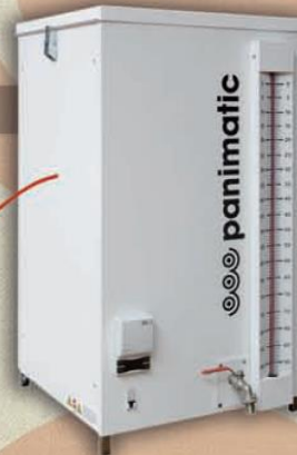
REV 90/50 avec groupe à distance